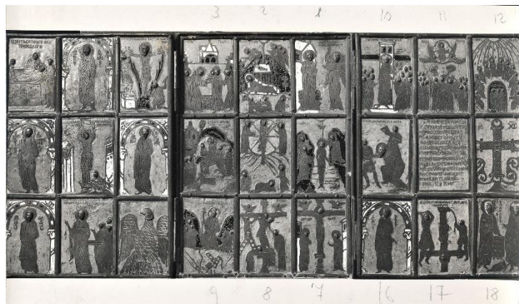
Fotografie di provenienza Matthiae, con note dello studioso, nei nuclei Pittura italiana e Scultura italiana della Fototeca Zeri a Bologna