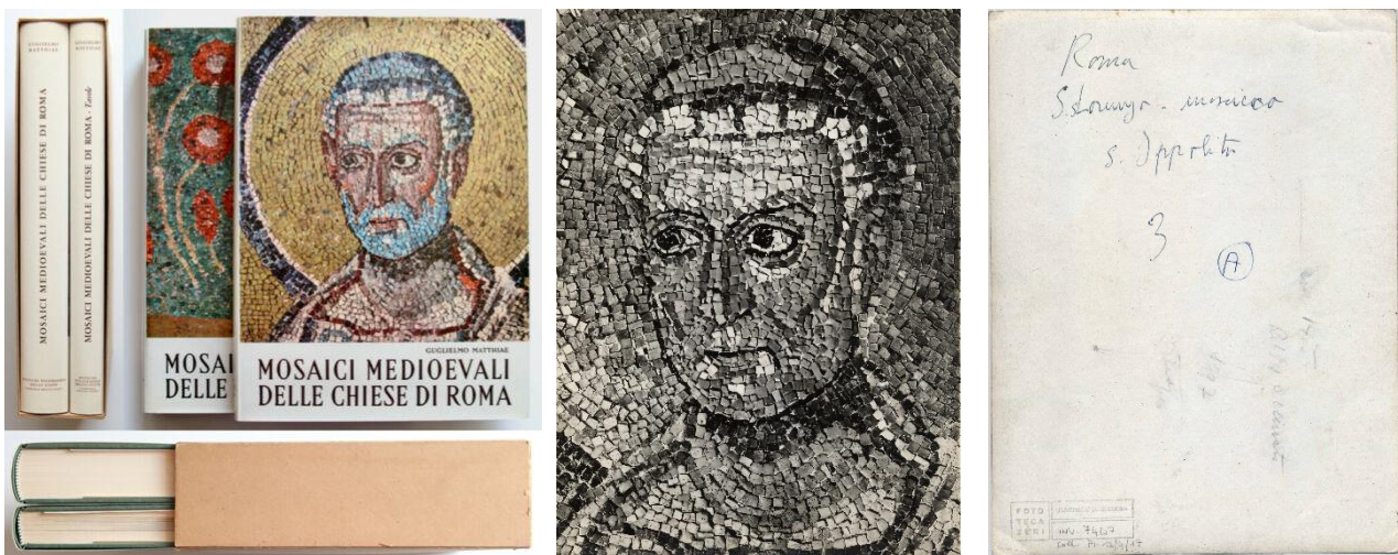
Pubblicazioni di Guglielmo Matthiae e fotografia utilizzata per l'apparato illustrativo, recto e verso. Bologna, Fototeca Zeri

Gli assegnisti, tramite una ricerca documentaria e anche attraverso interviste ad eredi o conoscenti, dovranno inoltre approfondire le modalità di creazione della fototeca da parte di Matthiae, e di utilizzo del medium fotografico per gli studi e nello svolgimento dell'attività professionale.